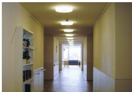
Wels – prostornou chodbou se klienti dostanou ke svým pokojům

Každá jednotka má „domácí centrum“ s obývacím pokojem, jídelnou a kuchyň-