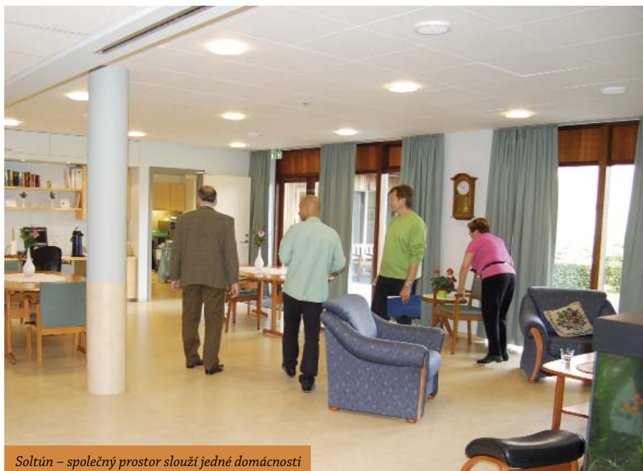
Soltún – společný prostor slouží jedné domácnosti

Centrem každé z nich je velký společný prostor, který sestává z kuchyňské části, jídelny a obývací části. Okolo tohoto „srdce domácnosti“ je cca 10–12 jednolůžkových pokojů s předsíňkou a vlastním sociálním zařízením. Každá domácnost má i vlastní