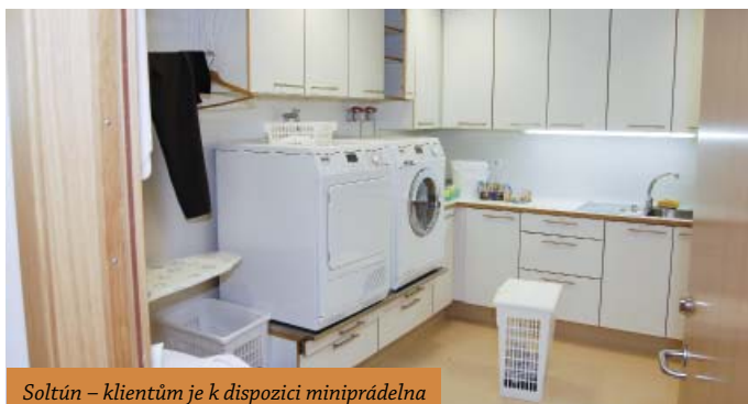
Soltún – klientům je k dispozici miniprádelna