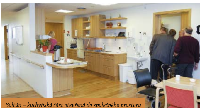
Soltún – kuchyňská část otevřená do společného prostoru

Je samozřejmé, že již před nástupem jsou zájemci informováni, jakým způsobem domov funguje. Zejména ženy, které se celý život staraly o chod domácnosti, tento systém vítají, neboť odpadá pocit neužitečnosti, který mnohé po nástupu do domova mají. Rozhodně není vhodný pro typy klientů „já si platím, tak se starajte“. Velkou výhodou tohoto konceptu