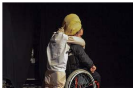
Z divadelního představení Bábka Divadla bez domova Bratislava

Počet přednášejících a vystupujících byl sice nižší, ale díky většímu prostoru pro prezentace poskytnutému menšímu počtu odborníků bylo předávání jejich zkušeností a dovedností mnohem efektivnější. Tomu napomohly i navazující panelové diskuse, které přednášející vedli ve čtyřech samostatných skupinách. Interakce mezi přednášejícími a účastníky konference tak byla mnohem intenzivnější a oboustranně obohacující.